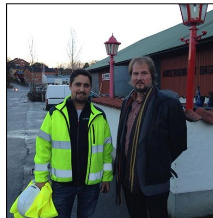
Arbetsmarknadskampanjen. Besök på byggföretaget Andersson&Baggman. Mansdominerat. Intressant med givande diskussioner. Bl. a. om SD..... Tuffa krav med Lavaldomen på både anställda och företag.