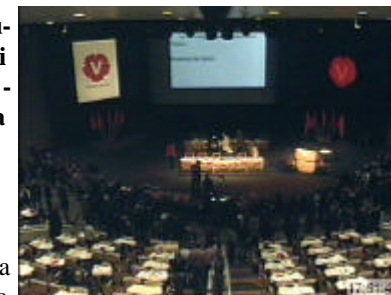
Kongressalen i Svenska mässan, Göteborg.

i partiet, dock inte enhälligt. 25 ombud valde att stryka hans namn på valsedlarna.